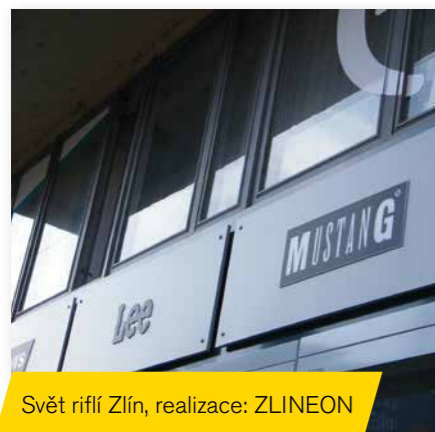
Svět řířil Zlín, realizace: ZLINEON