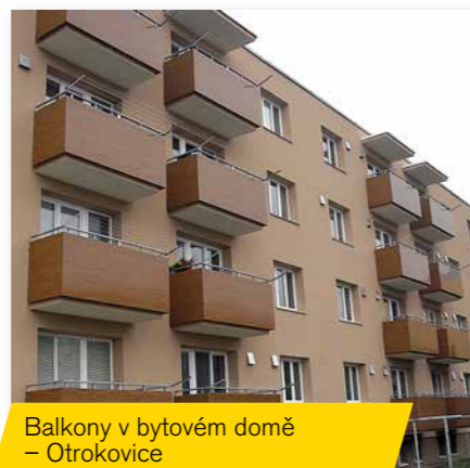
Balkony v bytovém domě – Otrokovice