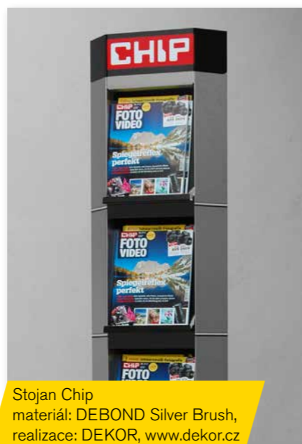
Stojan Chip materiál: DEBOND Silver Brush, realizace: DEKOR, www.dekor.cz