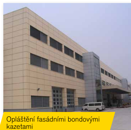
Opláštění fasádními bondovými kazetami