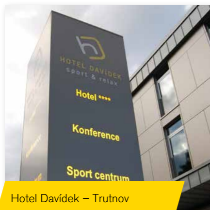
Hotel Davídek – Trutnov