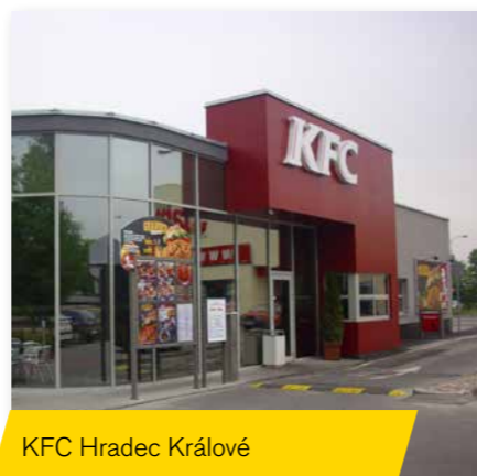
KFC Hradec Králové